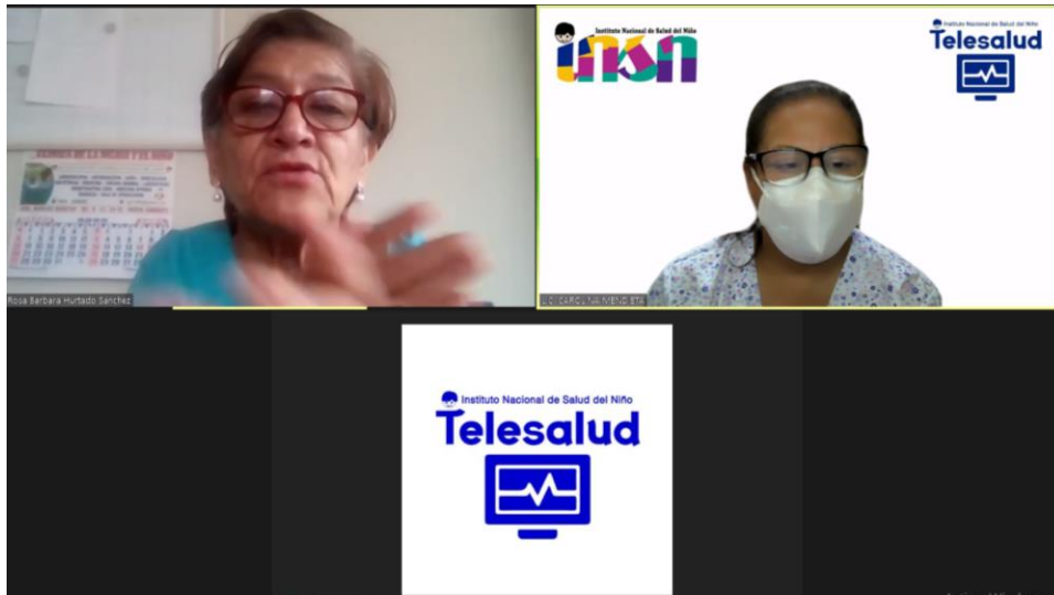
Teleinterconsulta realizada por Lactancia Materna.